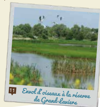
11 Evol d'oiseaux à la réserve de Grand-Laviers