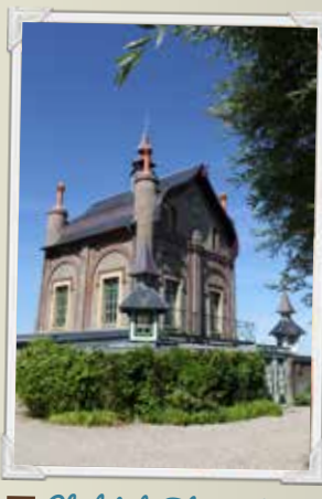
B Chalet de Blanquetaque