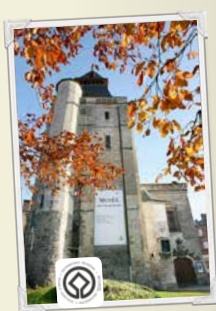
6 Le beffroi d'Abbeville