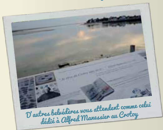
D'autres behéldères vous attendent comme celui dédié à Alfred Manessier au Crotoy