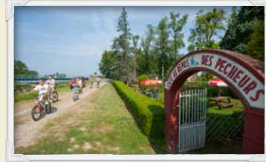
12 Pause bienvenue au Repos des pêcheurs