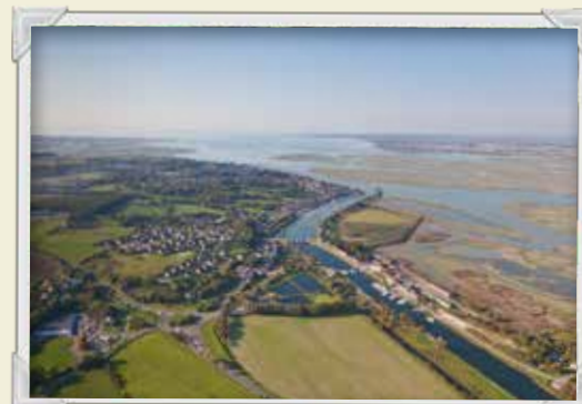
La baie et la vallée vous offrent un bain de nature