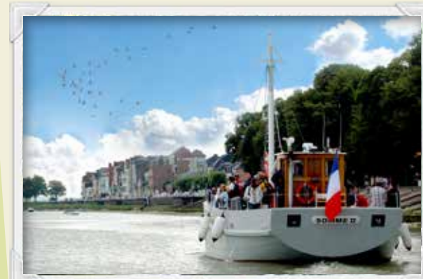
18 Le baliseur Somme II